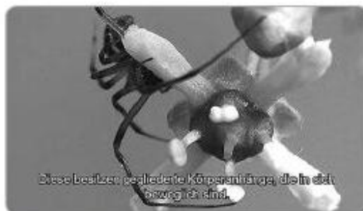
Abb. 2: Untertitel zur Förderung der Lesekompetenz 6

Hier hat der AV-Medien-Hersteller sehr gute Arbeit geleistet. Anders als häufig im Fernsehen entsprechen die deutschen Sprechertexte genau den gesprochenen Texten. Dadurch kann wortgetreu mitgelesen werden.