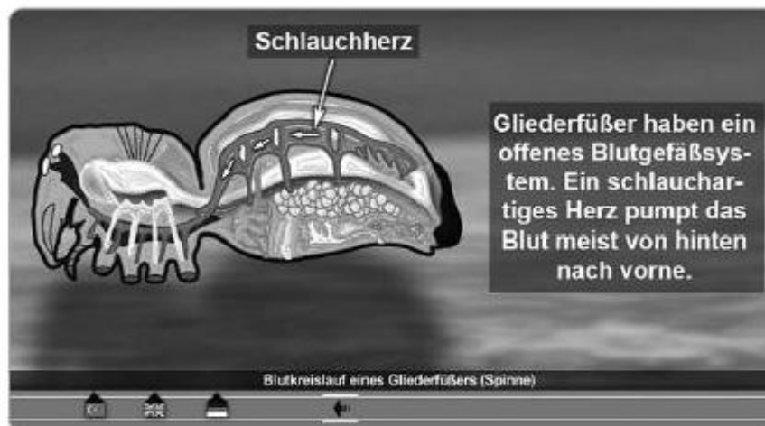
Abb. 5: Grafiken mit Texttafeln 6

Eine didaktische DVD ist weit mehr als die klassische Videokassette. Werden alle Möglichkeiten ausgeschöpft, kann so ein moderner abwechslungsreicher Unterricht gemacht werden. Sowohl lehrerzentrierte Unterrichtsformen, als auch ein offener schülerzentrierter Unterricht profitiert von diesem Medium. Durch die Möglichkeit von Untertiteln, Arbeitsblättern, interaktiven Arbeitsblättern und Grafiken muss wieder gelesen werden. Da die Texte kurz sind und häufig eine Text-Bildzuordnung verlangen, fördern sie die Lesekompetenz. Durch die Internetlinks können bessere Leserinnen und Leser zusätzlichen Input erhalten.