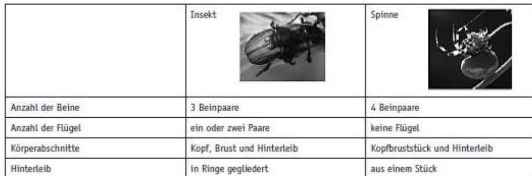
Abb. 4: Aufgabe zur Bearbeitung für die Schüler 6